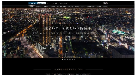
【Brillia Tower 池袋 プレミアムサイト】

現在の中古マンション市場は新築マンション市場に牽引され、価格の上昇が続いております。こうした中、東京建物不動産販売では WEB サイトでの情報発信に加え、「Brillia 認定中古マンション制度」や「Value Up Service」などの充実したサービスも提供することにより、東京建物の分譲マンションの価値向上やお客様に安心していただける中古取引の実現を目指してまいります。