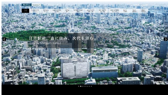
【Brillia Towers 目黒 プレミアムサイト】

なお、大規模物件については、マンションごとに“公式サイト”や“プレミアムサイト”をご用意し、マンションのコンセプトや共用施設の紹介、フォトギャラリーなどの多彩なコンテンツを掲載することで各マンションの魅力を細部までご紹介しております。(全 25 棟)