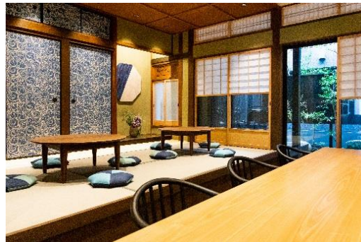
【京町家棟 1階ラウンジ】